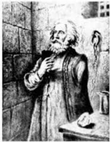
В. Косіян. «Давня казка»